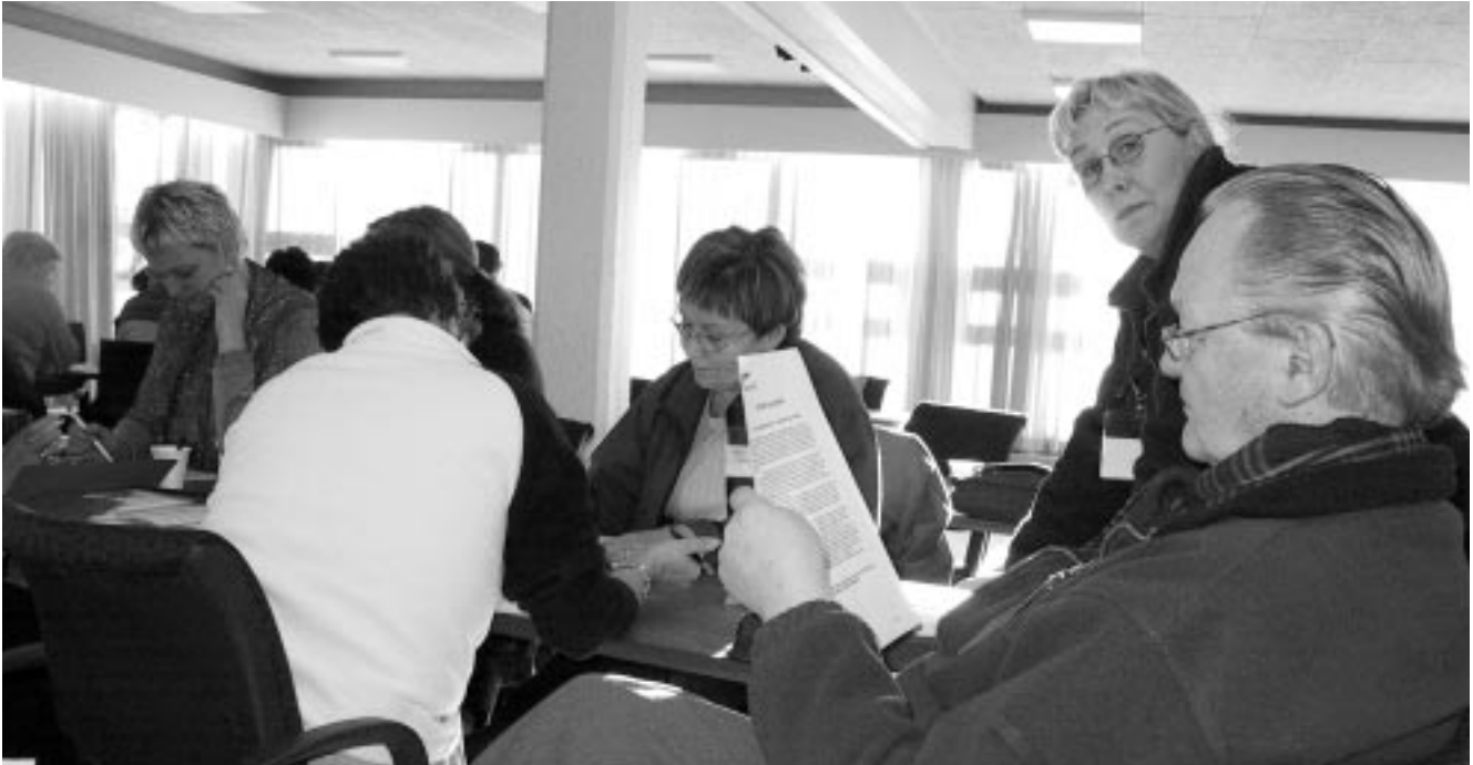
Trúnaðarmenn á námskeiði, bæði er boðið upp á grunnnámskeið og framhaldsnámskeið. Auk þess eiga trúnaðarmenn kost á margvíslegu itarefni frá félaginu.