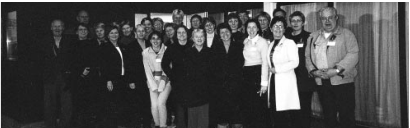
Pau verja réttinn. SFR-félagar á trúnaðarmannanámskeiði í nóvember.

Tölvulæsisáttak BSRB sem hófst sl. haust fékk frábærar viðtökur hjá félagsmönnum SFR. Fræðslan er í samvinnu við Nýja tölvu- og viðskiptaskólann (NTV) í Kópavogi, Hafnarfirði og Selfossi ásamt því að samvinna er við ýmsa tölvuskóla á landsbyggðinni. Samningurinn sem gerður var við þessa aðila gerir ráð fyrir að á skólaárinu 2001 til 2002 verði haldin 100 námskeið og er áætlað að um 1500 manns úr aðildarfélögum BSRB sækji fræðsluna.