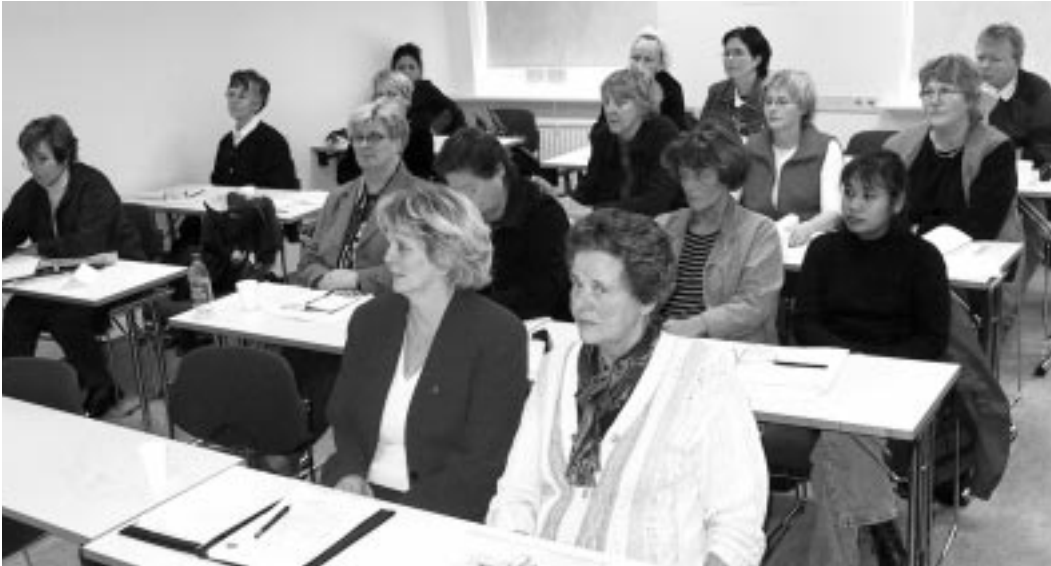
Mennt er máttur. Fjöldi manna bókaði sig á námskeiðið Rekspölur II.

ast í Munaðarnes af fjölskyldu-ástaðum og því verður eitt námskeið haldið eingöngu í Reykjavík. Þá verða tvö námskeið haldin á Akureyri og eitt á Selfossi.